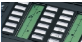
Etiquetas que puede personalizar. Amplias teclas transparentes

Las teclas programables del sistema o de usuario están disponibles en Alcatel Reflexes™. Las etiquetas se pueden estandarizar a nivel corporativo y/o definir las por el usuario. Determinar el estado de una llamada es sencillo con la ayuda de los iconos de fácil comprensión que reemplazan a las combinaciones de LED de difícil comprensión. La lectura de la etiqueta asociada a cada tecla es sencilla porque la tecla de la parte superior está equipada con unas lentes integradas que aumentan el tamaño de las letras. Esta parte superior de la tecla está patentada como característica Alcatel.