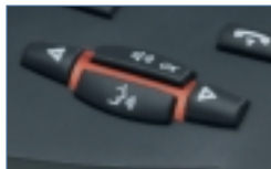
Teclas de control audio

Las funciones de control audio (volumen del altavoz o control del audio en manos libres, secreto, etc) están separadas de las teclas de función del sistema para facilitar un control audio sencillo y claro para el usuario.